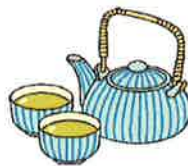
宇治茶 (株)松北園茶店