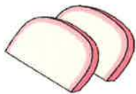
かまぼこ (株)はまー