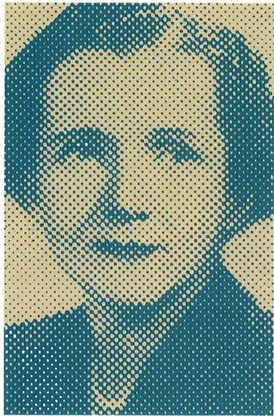
レイチェル・カーソン (1907~1964)

アメリカの海洋生物学者。化学物質による環境汚染についていち早く警告した。彼女の著書「沈黙の春」「センス・オブ・ワンダー」はいまも読みつがれている。