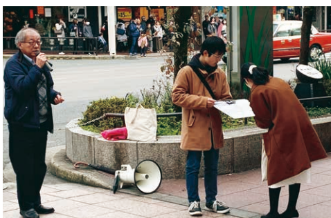
署名をお願いします