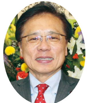
参議院議員日本共産党・ 井上 さとしさん