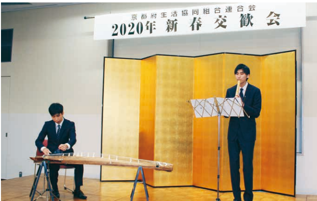
同志社大学邦楽部のみなさんによる祝賀の演奏