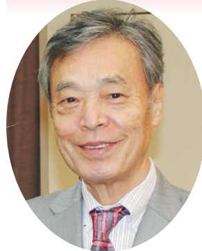
衆議院議員日本共産党・ こくた 恵二さん