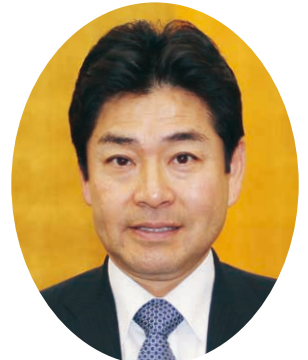
衆議院議員無所属・ 山井 和則さん