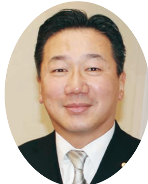
参議院議員立憲民主党・ 福山 哲郎さん