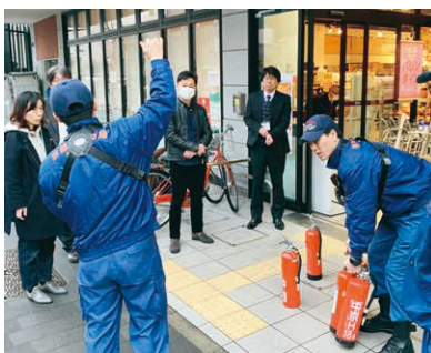
消防署からの訓話や消火器訓練

1月16日(木)、午前8時に京都市内を震源とする震度6強の地震が発生したものと想定。家屋の倒壊・道路の寸断・火災発生等を想定し、会員生協との間で「職員の安全確認・被害状況確認・対策本部の立ち上げ等」について非常用通信機器(MCA無線)やメール・FAXを活用した通信訓練をおこないました。 当日は午前8時45分、京都府生協連事務所内に対策本部を立ち上げ、会員生協からの連絡を受けました。