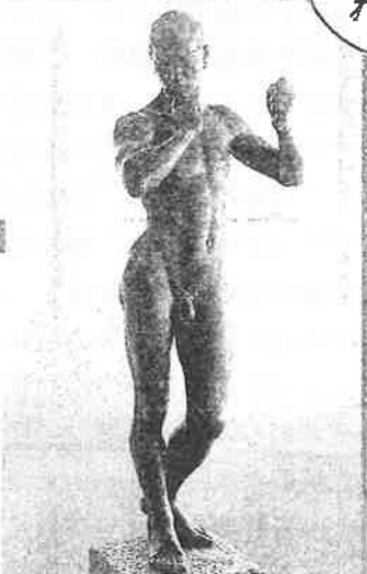
「わだつみ像」本郷新制作