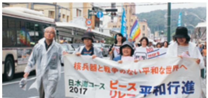
鳥取県の生協のみなさん

6月21日(水)、「2017年ピースパレード京都」が取り組まれました。「平和と核廃絶の願いをもちより、広島・長崎の世界大会につなげよう」との趣旨ではじまった京都の生協のピースパレードは、今年で34回目をおこなえました。 京都府生協連のよびかけで、京都生協・生協コープ自然派京都・大学生協などのほか、鳥取県の生協からの参加もあり、組合員・役員100人が「みんなでいこうピース&ピース 今ある平和はたからも