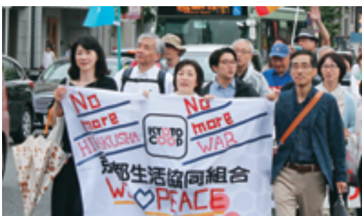
京都生協役員のみなさん

の「未来をつくるのはわたしたち」『ヒバクシャ国際署名』をひろげましょう！」をテーマに、街ゆく人びとに力づくよく訴えました。 あいにくの雨となった今年のパレードでしたが、行進が始まるころには雨も上がり、多くの観光客の中を祇園石段下から四条通り、河原町通りをすすんで、京都市役所へ。 全国の被爆者らが中心となつてすすめる「ヒバクシャ国際署名」への協力を呼びかける折り鶴や署名用紙を配りながらの行進となりました。パレードの出発の前に、円山公園内で出発集会が開かれました。