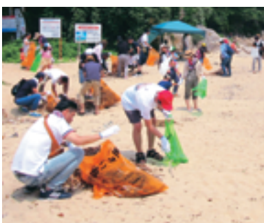
ごみ除去作業のボランティア活動

6月24日(土)には、海水浴シーズンを前に、舞鶴市三浜の竜宮浜において、海水浴場の流木やペットボトル、海藻などのごみ除去作業のボランティア活動をおこないました。京都労福協会員の家族など140人が参加しました。