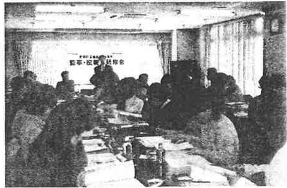
講師のお話熱心に聞き入るみなさん

なお、組合員から組合員名簿等の閲覧をもとめられた場合については、厚労省に確認した結果、「開示目的が