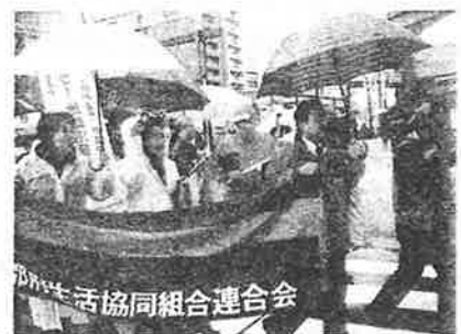
スタート直後は雨でしたが、議定書発効時刻の午後2時すぎには雨もあがって