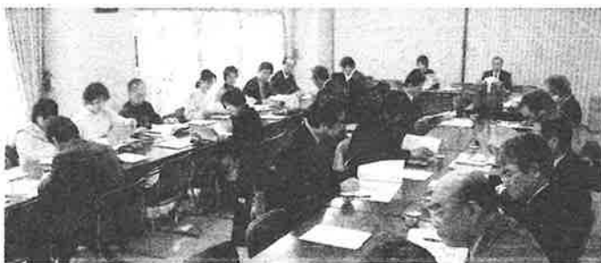
熱心に聞き入る参加者のみなさん

現在、日本の生協は数十万以上の組合員から構成される生協も数多くみられるとおり発展・成長してきましたが、生協法はそのような規模の組織運営・事業活動をおこなう生協の姿を想定していないため、法制度としては現在の状況と大きなズレが生じています。こうした問題をうけて、法改正へむけての動きが急速にすすみだしていることがわかりました。