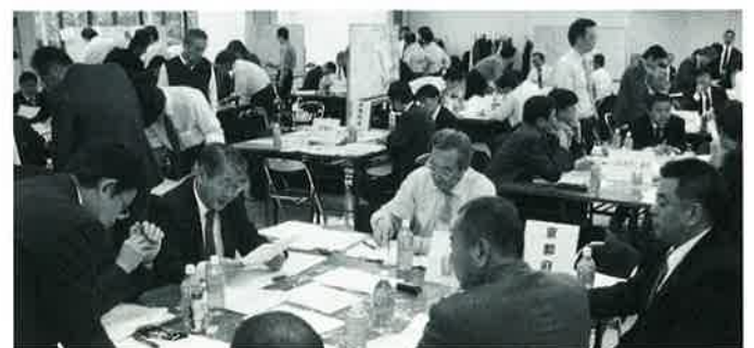
10グループに分かれて図上演習。手前は京都グループのみなさん

（発災）2日目、発災後3・4日目、同1週間以降の3つのフェーズ（局面）において、自生協の事業継続、再開のための取り組みの問題点と課題の抽出に重点をおきながら、応急生活物資要請への対応や広域応援のあり方等について点検・見直す場としました。また、参加者にとっては、平常時からの備えの大切さを実感する場ともなりました。近畿2府4県から総勢81人、うち京都からは8人（京都府生協連1人、大学生協1人、京都府、奈良県、和歌山県の防災担当の方もオブザーバーとして参加されました。