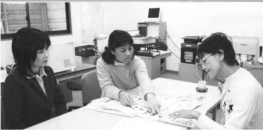
カタログを囲んで話がはずみました

コープ自然派ピュア大阪から支援にきてもらいました。伏見区に事務所を借り、求人募集をし、職員1人、配達アルバイト1人、営業3人で出発しました。生協設立に賛同してくださる方が700人を超えたところに、ここ八幡市上津屋尼ヶ池に事務所（センター）を移しました。昨年の3月ごろです。