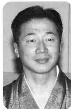
民主党 参議院議員 福山哲郎さん