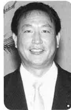
民主党 衆議院議員 北神圭朗さん