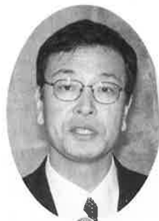
農林水産省近畿農政局 前川泰一郎次長