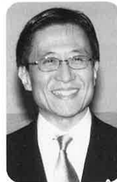
民主党 参議院議員 松井孝治さん