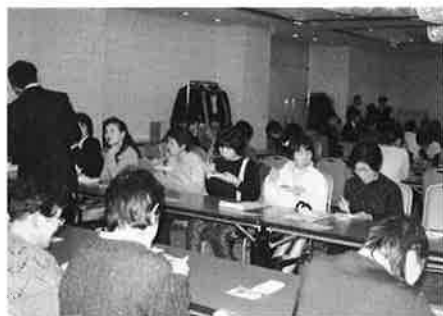
試食をしながら意見交換しました

それぞれの食品について原材料・生産工程などについて説明をうけながら、京都の味をたしかめました。