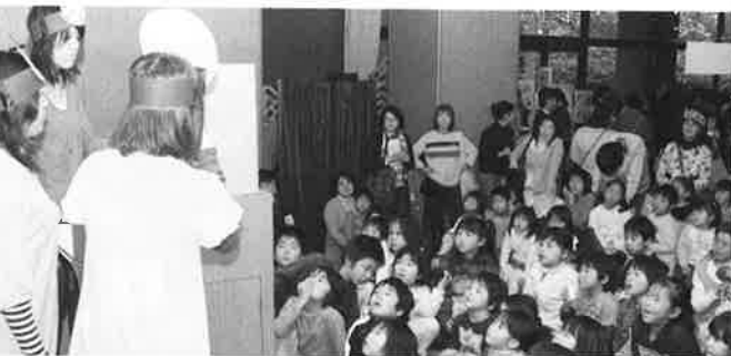
食育紙芝居が大人気でした!

2月23日(土)、龍谷大学深草学舎で京都生協主催・せいきよう虹の会協賛による「第10回商品大交流会」が開催され、組合員・役職員・取引先ふくめて500人が参加しました。