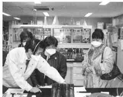
山城北保健所の施設を見学しました

京都府からは、府内での行政検査で見つかった春菊の残留農薬基準違反事例について、その