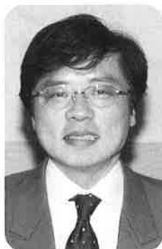
日本共産党 参議院議員 井上さとしさん