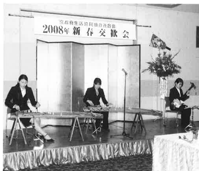
京都橘大学箏曲部の学生のみなさんによる祝賀の演奏

京都橘大学箏曲部の学生のみなさんによる祝賀の演奏が、お正月らしさをいっそうひきたててくれました。