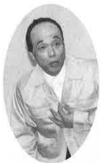
〔東国原 宮崎県知事〕