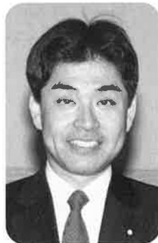
民主党 衆議院議員 山井和則さん