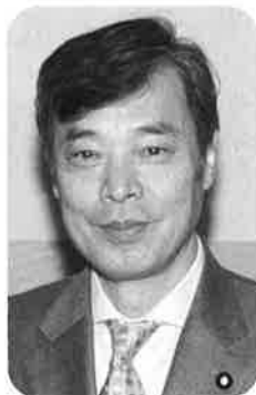
日本共産党 衆議院議員 こくた恵二さん