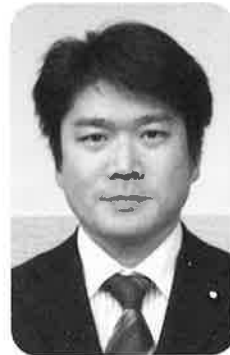
自由民主党 衆議院議員 山本ともひろさん