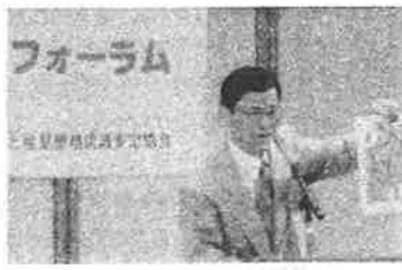
<話題提供>「いま、なぜ食育なのか」 農林水産 近畿農政局 山川雅典局長